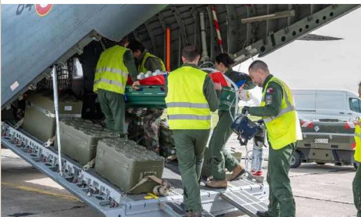
Préparation opérationnelle des équipages médicaux sur « CASA nurse »

Ainsi, les avions au départ ou à destination de la BA105 volent quotidiennement afin de réaliser les missions confiées à l'armée de l'Air et de l'Espace, dans le but de s'entraîner, de maintenir une haute technicité et d'apporter un appui aux missions de défense du territoire. Soyez convaincus qu'ils mettent tout en œuvre pour limiter au maximum les gênes qui pourraient être engendrées par leurs activités ! ■