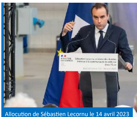
Allocution de Sébastien Lecornu le 14 avril 2023

La jeunesse n'est pas non plus en reste, c'est un des sujets d'importance. Il est primordial de les intégrer lorsque cela est possible via les forums, associations, programmes etc.», annonçait le ministre lors de son allocution.