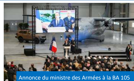
Annnonce du ministre des Armées à la BA 105

C'est tout le sens de la convention signée à cette occasion entre le ministère des Armées et les 22 collectivités territoriales en présence. Cette prédisposition prévoit notamment la mise en place de référents dédiés et la création de guichets uniques, car selon Sébastien