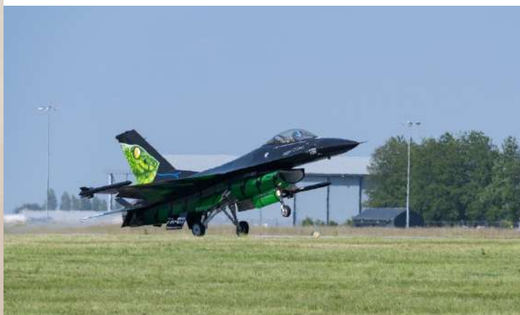
Escale d'un avion de combat F-16 de l'armée de l'air belge sur la BA 105

Enfin, elle accueille fréquemment des avions de chasse participant à la « police du ciel » ou PO (Permanence Opérationnelle), afin de protéger et défendre le territoire national, et d'assister des