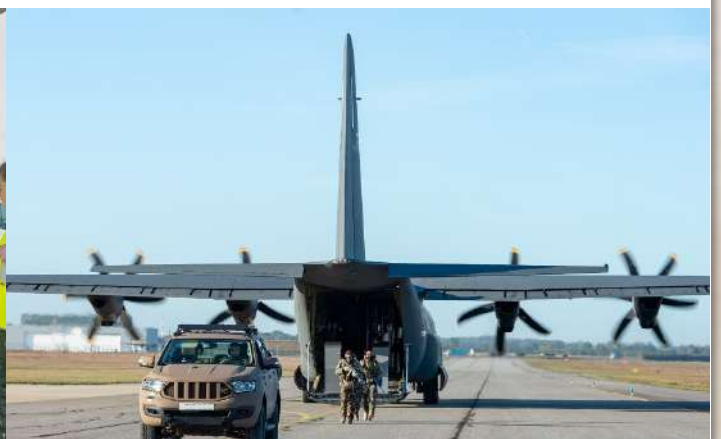
Posé tactique C130-J