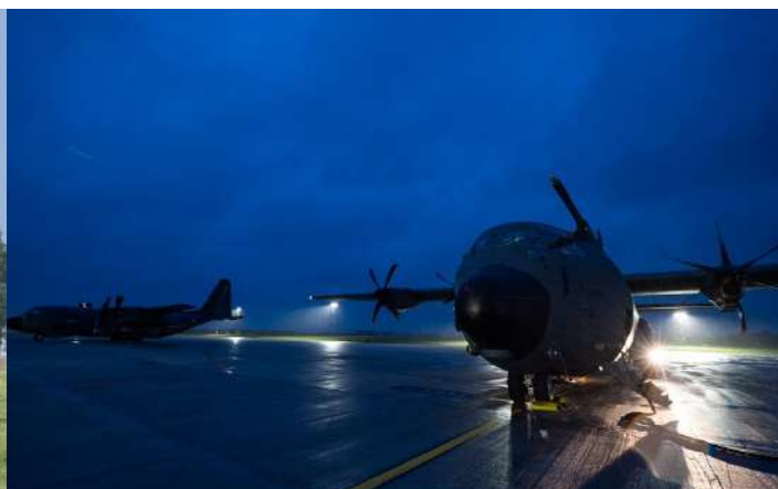
Entraînement vol de nuit C130-J