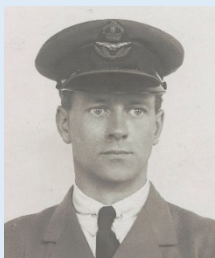
Lieutenant Arthur Whitten Brown

Les deux hommes sont devenus des héros pour avoir ouvert la voie aux vols transatlantiques et ont été faits chevalier au Palais de Buckingham à Londres.